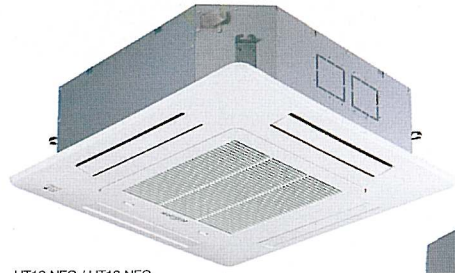
UT12 NEC / UT18 NEC